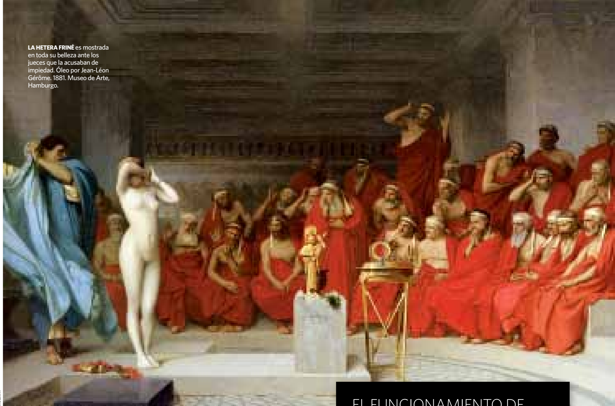
LA HETERA FRINÉ es mostrada en toda su belleza ante los jueces que la acusaban de impiedad. Óleo por Jean-Léon Gérôme. 1881. Museo de Arte, Hamburgo.

Los asuntos que no concernían a la jurisdicción penal los juzgaba el pueblo. El aumento de los contenciosos de tipo comercial y el desarrollo del Imperio ateniense provocó el nacimiento de la figura de los diaithetes , un tribunal de arbitraje formado por atenienses de más de sesenta años de edad —edad en la que terminaban sus obligaciones militares— que ejercían de árbitros públicos durante un año. Este procedimiento era rápido y barato —las partes