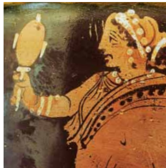
MUJER ACICALÁNDOSE ANTE UN ESPEJO. DETALLE DE UN VASO NUPCIAL PROCEDENTE DE LÍPARI. 340 A.C.