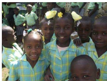
Alumnos de Bresma Castaches