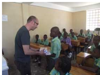
Un padrino conociendo a su apadrinado en la Escuela Bresma en Port-au-Prince, Haití

Con 21 € al mes reciben educación, alimentación, libros y uniformes, sin duda la mejor cooperación al desarrollo!!