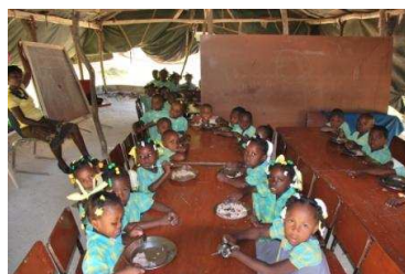
Los pequeños de Castaches