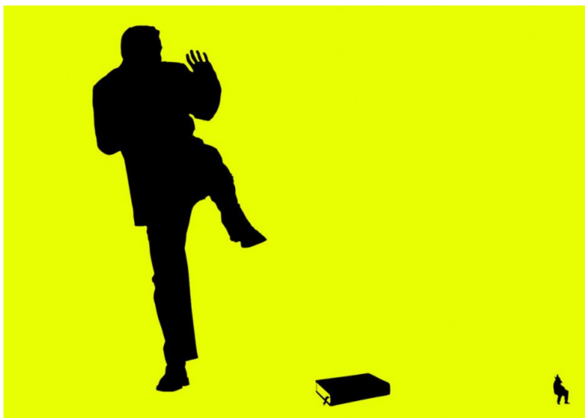
LA BOCA DEL LOGO

A diferencia de otros medios, en CTXT mantenemos todos nuestros artículos en abierto. Nuestra apuesta es recuperar el espíritu de la